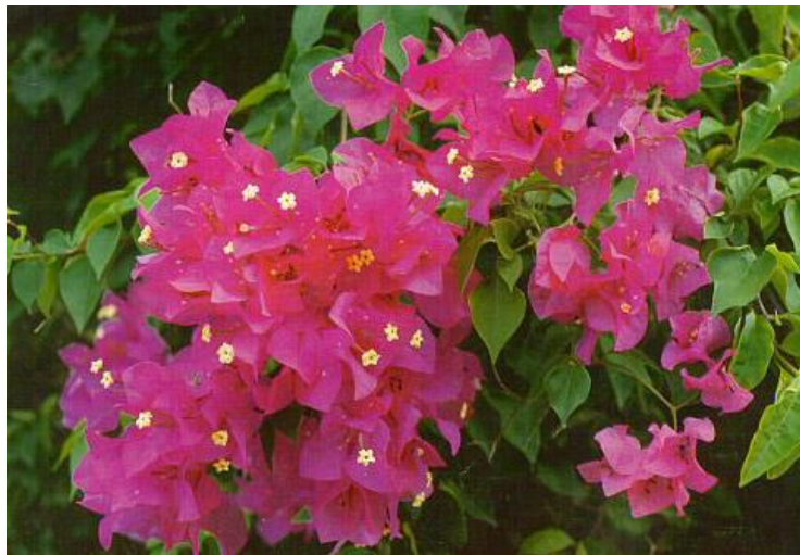
มงคลความหมาย

นับเป็นพันธุ์ไม้ที่มีความโดดเด่น เพราะดอกจะมีสีสดสวย และมีกลีบดอกบางเบา ผู้ที่พบเห็นจะเกิดความสุขสบายใจ ทำให้มีความสดใส ร่าเริง และมีชีวิตที่เฟื่องฟูรุ่งเรือง เช่นเดียวกับการเติบโตของเฟื่องฟ้า